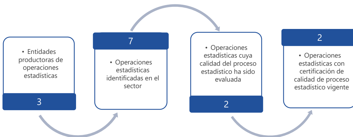
Gráfico 1. Principales características de la producción de operaciones estadísticas del sector de Actividad Política y Asociativa