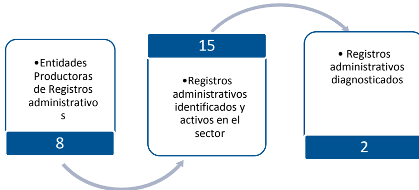
Gráfico 3. Principales características de la producción de registros administrativos del sector Ambiental