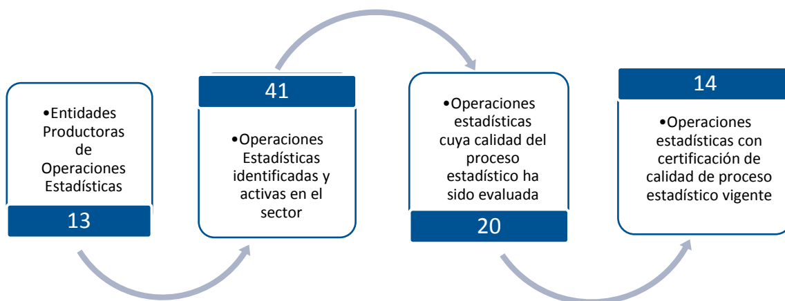
Gráfico 1. Principales características de la producción de operaciones estadísticas del sector Ambiental